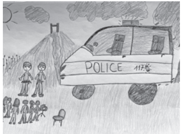
Police municipale - Eliza 5H