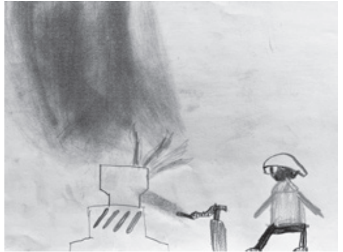
Extinction d'un incendie - Rayan 5H