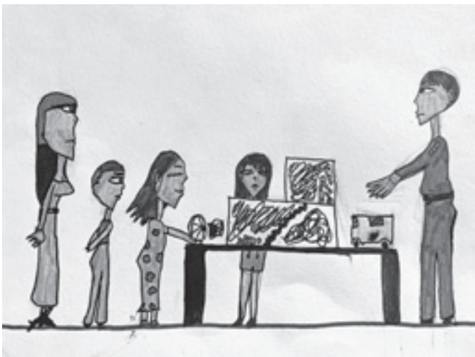
Prévention des séismes - Amira 5H