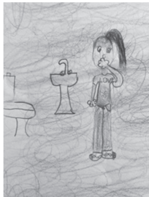
Se repérer dans la fumée - Alix 4H

Retour en dessins sur quelques-uns des 10 ateliers de prévention proposés aux enfants. De belles et riches découvertes pour chacun !