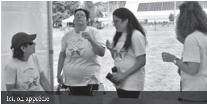
Ici, on apprécie