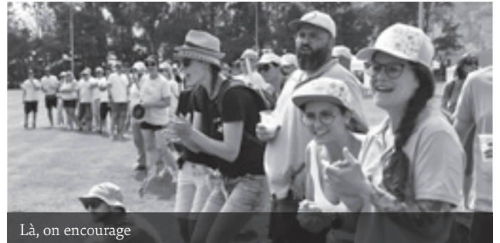
Là, on encourage