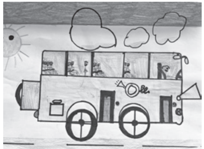
Sécurité dans les transports scolaires - Amanda 5H