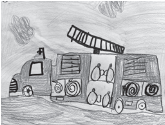
Le camion de pompier - Jeanne 4H