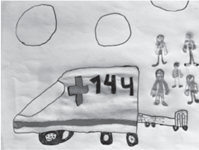
L'ambulance - Hana 5H