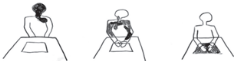
Belle illustration d'Ella Reilly pour expliquer ce qu'est l'art thérapie : déposer pour se libérer.

Pourquoi encore attendre, n'hésitez pas à me contacter pour prendre rendez-vous.