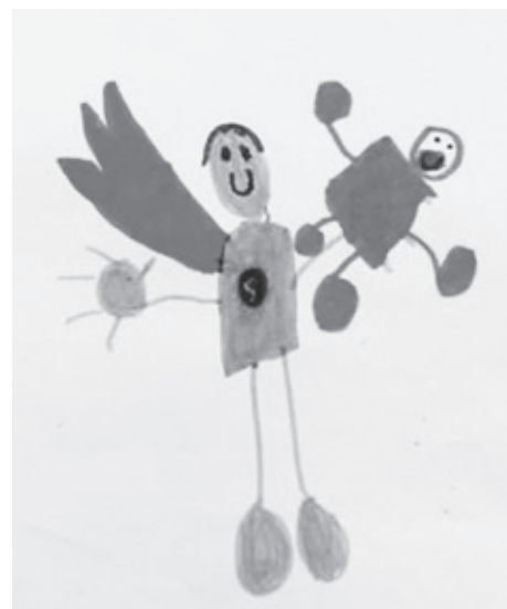
Super Héros à la poupée