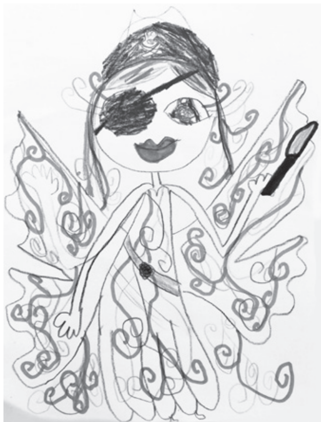
La fée pirate