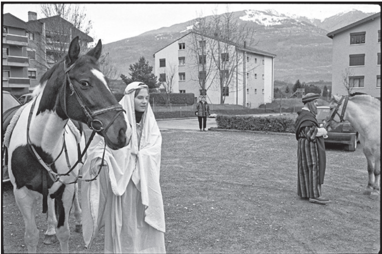
Deux chevaux, un Roi Mage, une jeune fille, Marie probablement. Elle va rejoindre Saint-Nicolas, sa charrette et son petit cheval, quelques bergers moustachus et chapeautés, une ou deux vaches d'Hérens, un joyeux mélange.

Ад той пары і да сёння захаваўся звычай ладзіць маскарад на новы год, абменьвацца падарункамі, вадзіць карагоды.